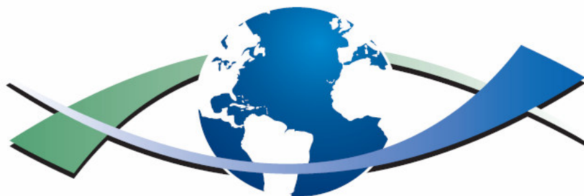
Figura 1: Logo do Projeto

Inicialmente, optou-se pela criação de um logo para o Projeto ( Figura 1 ), para representar o processo de interação entre as MPEs com seus diferentes públicos, respaldada pelas novas tecnologias, num contexto globalizado, em que a seta verde representa os públicos e a seta azul as MPEs, as novas tecnologias.